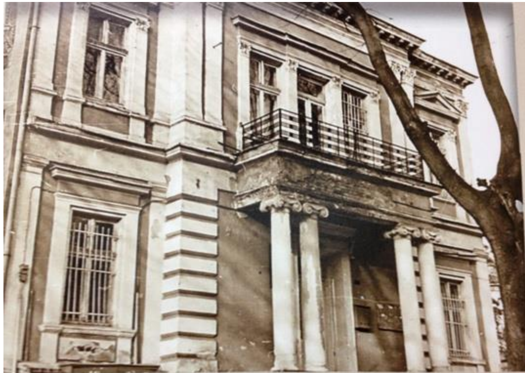
Сградата на Пловдивското окръжно управление, завършена през 1893г.

http://tvnatural.eu/news/iosif-shniter.html