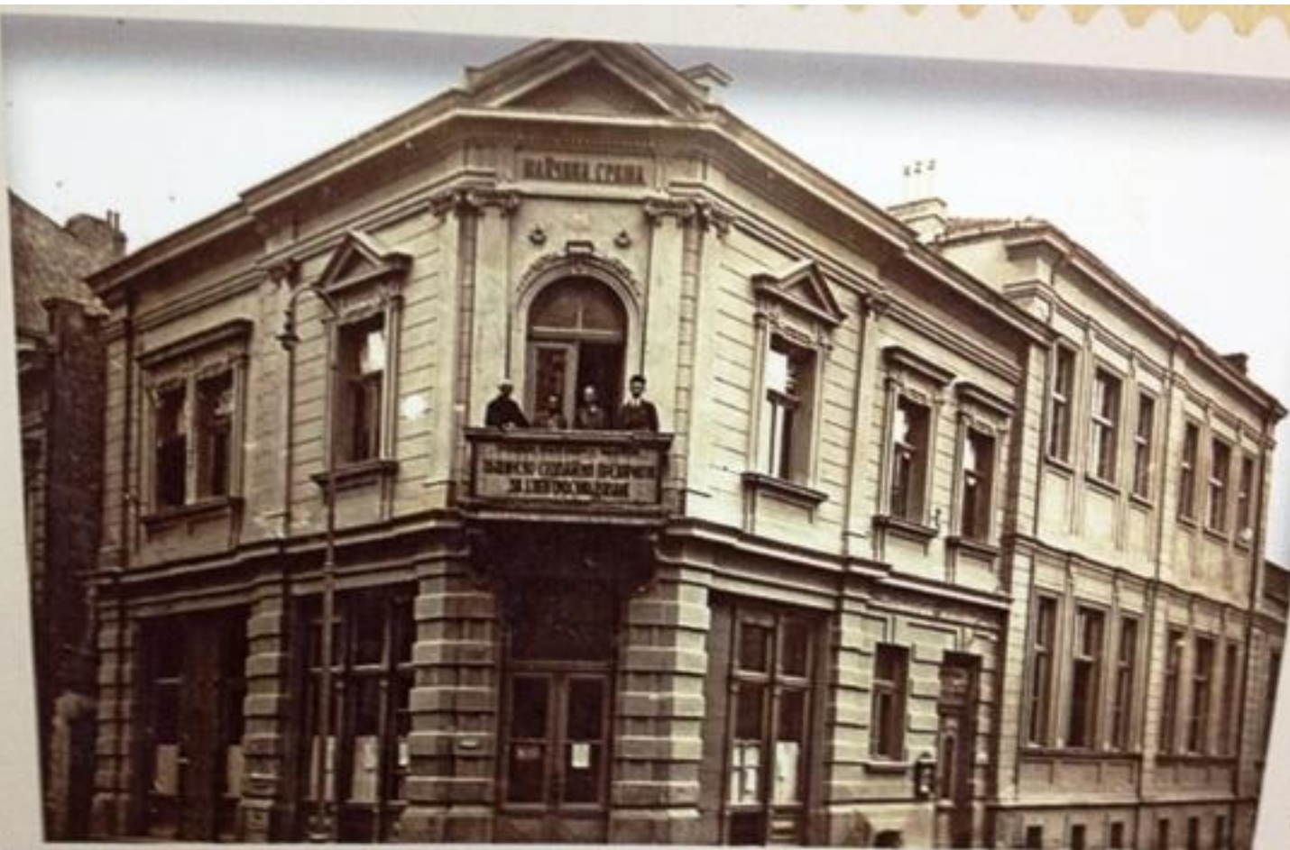
Общинското предприятие за електро- снабдяване в сградата на Женското дружество "Майчина грижа" Днес: Държавен куклен театър - Пловдив