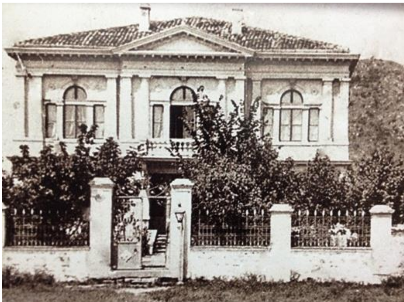
Домът на Иван Андонов, 1905 г. (една от първите сгради край Централна гара)