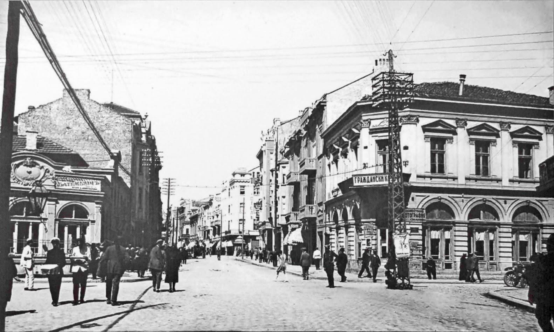
Пловдивъ — ул. Кн. Александъръ. Plovdiv rue Kn. Aleksandar