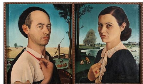
„Семеен портрет“, една от картините, с които Златю Бояджиев е участвал на Венецианското биенале през 1942 г.

През лятото на 1939 г., Златю Бояджиев заминава за Италия След това пътуване е забележима промяната в стилистиката му под влияние на ренесансовите майстори, най-вече на фламандския живописец Питер Брьогел Старши, и италианските прерафаелити, които се считат за първите авангардисти в изкуството, реформатори, които насищат сложните си композиции с детайли и наситени цветове, като същевременно се опитват да възвърнат силата на религиозната живопис. С картините „Брезовски овчари” и „Пъдари” Златю Бояджиев участва в XXIII Биенале във Венеция през 1942 г. Това е първото участие на България със собствен павилион от 100 произведения на 35 български художници, между които са Васил Захариев, Васил Стоилов, Здравко Александров, Владимир Кавалджиев, Борис Денев, Дечко Узунов, Цанко Лавренов и др.