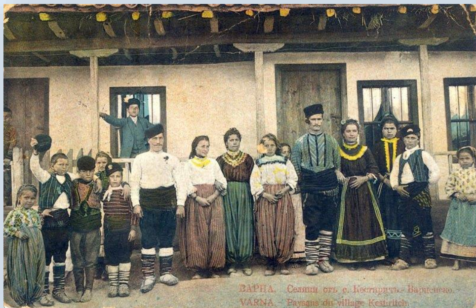
Abb. 6: Bulgaren der Varna-Umgebung, Vinitza.