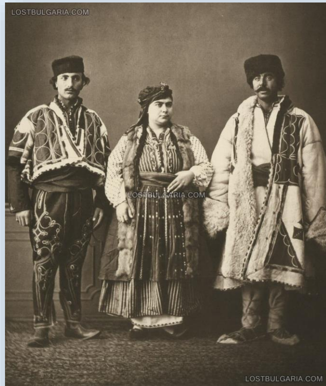
Abb. 5: Bulgaren von Dunaj-Gebiet, 1873.