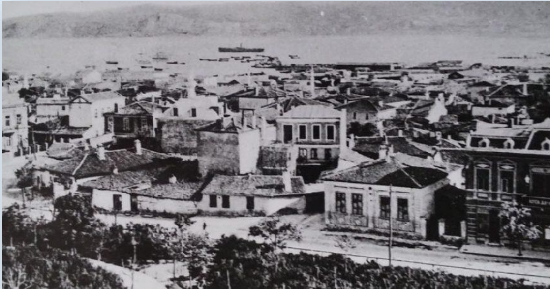
Abb. 1: Küstenstadt Varna.