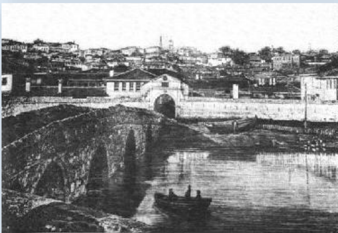
Abb. 2: Varna.