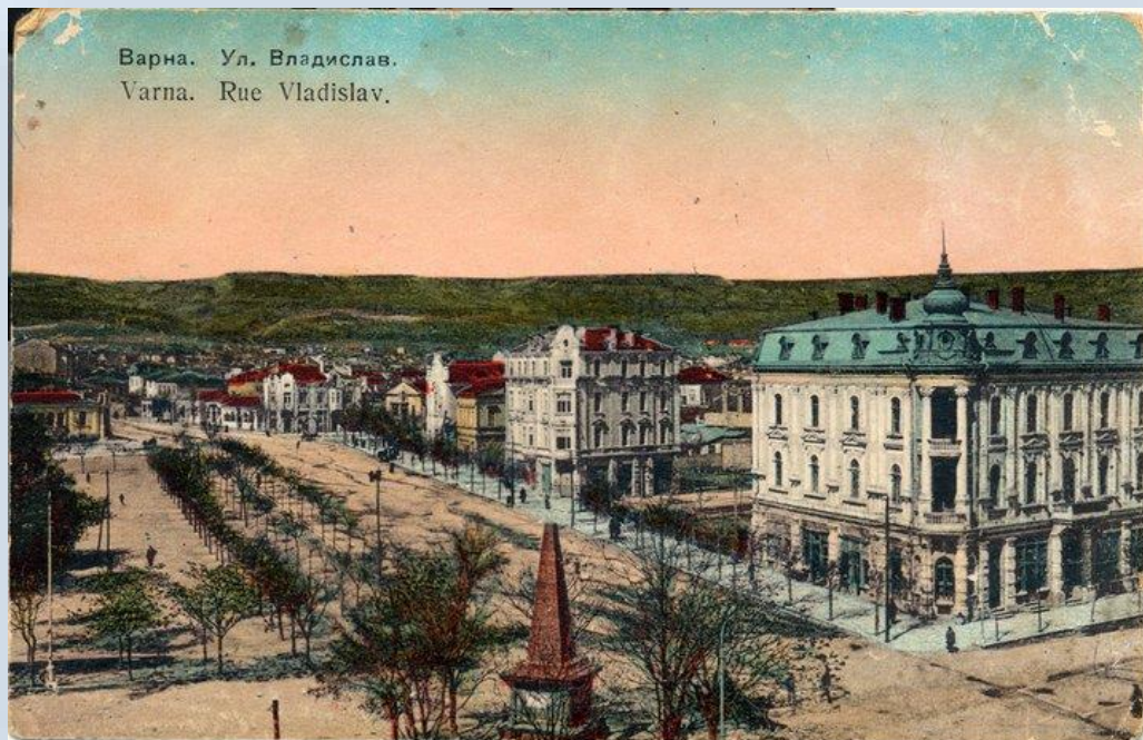
Abb. 4: Eine Postkarte: Varna, Vladislav Straße.