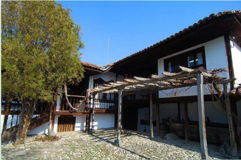
Abb. 3: Haus-Museum des Sliwensalltag.