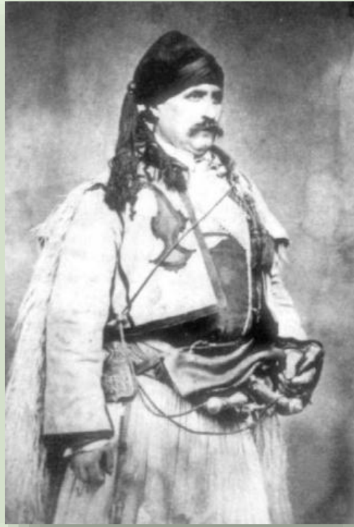
Abb. 5: Djado II' o Vojvoda.