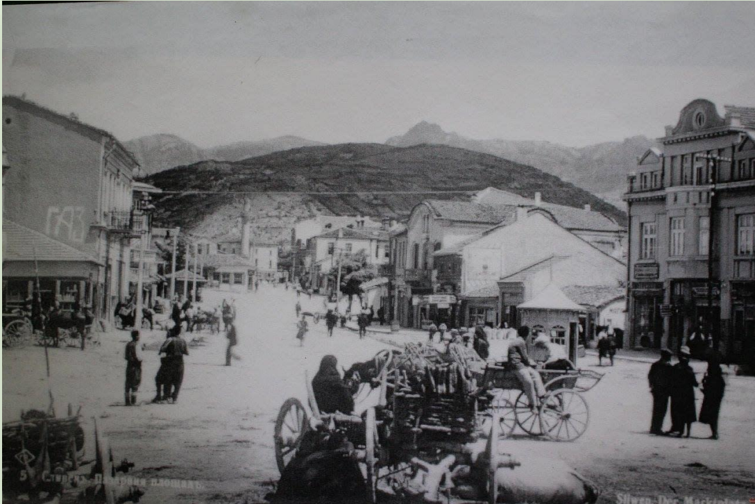
Abb. 1: Alte Sliven.