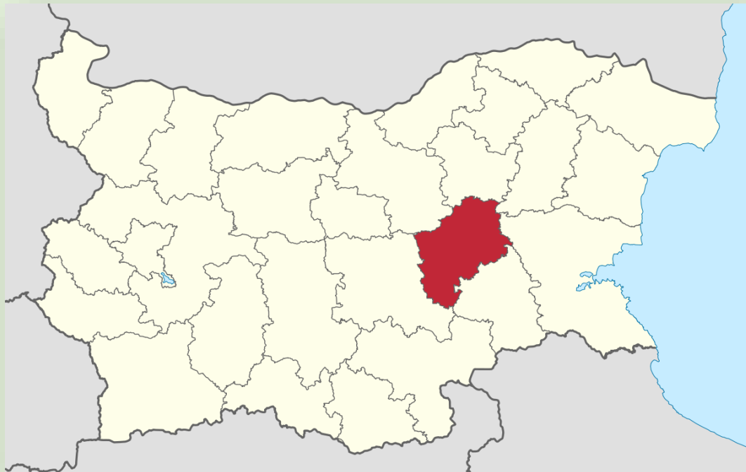
Abb. 4: Sliwen auf der Karte.