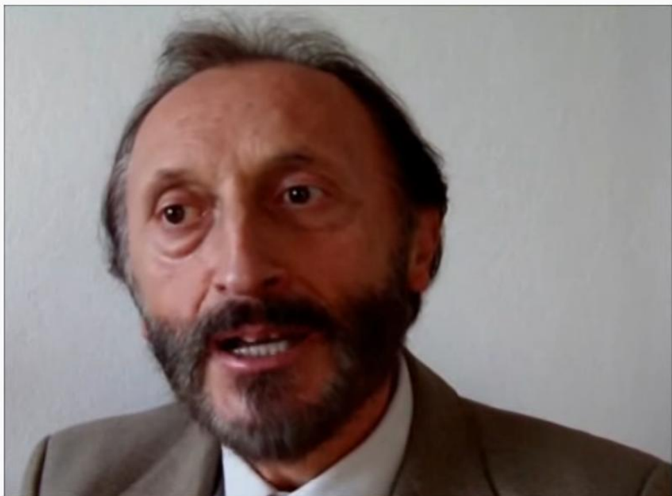
Иван Вазов - "Отечество любезно...", рец. Богдан Дуков