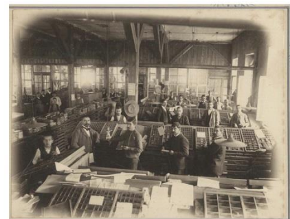
Печатницата на Христо Данов в Пловдив

На финала се завръщаме отново на днешната ул. „Христо Г. Данов“ (бившата ул. „Владимир Заимов, а преди това „Фердинанд“. На тази улица са домовете на пловдивските евреи, в чиито къщи е вградена тяхната история. Някои от тях и до днес живеят тук. На тази улица е културният дом – БЕТАМА, където се намират организацията „Шалом“ и читалището „Шалом Алейхем“. През 1941-1944 от тази улица е започвало еврейското гето. Тук са били принудени да се пренесат и всички евреи, живеещи в други части на града. Тази улица е била известна като улица на занаятчиите. И ние ще посетим книговезницата и къщата на Хр. Г. Данов, бащата на българското книгоиздаване. „Дружествена книговезница“, създадена през 1857, се превръща през 1862 г. в „Книгоиздателство Христо Данов и с-ие“, което се разраства постепенно и отваря