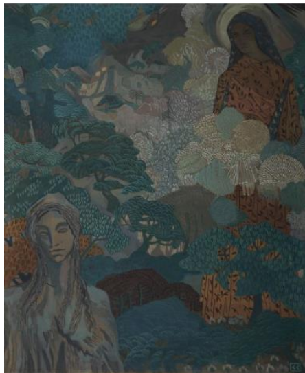
Благовест, 1910 г.

Ангели бели на бяло предвестие В бяла предутрин над нас пролетяха... Вишните цъфнали къпят корони - Бели корони във бяла предутрина.