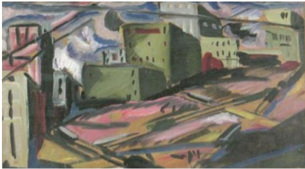
Градски пейзаж, 1920

Този начин на творчество е тясно свързан с течението на интуитивизма, което според Сирак Скитник най-точно определя съвременното изкуство: след Първата световна война изкуството става все по-малко рационално и се основава все повече на душата и интуицията.