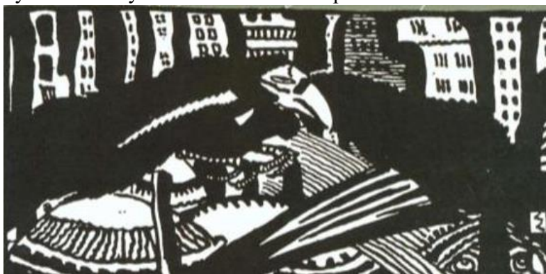
Илюстрация на „Гарванът“ от Едгар Алън По.

Той съчетава интереса си към визуалните изкуства и писането и в работата си като изкуствовед. През целия си живот той е написал повече от четиристотин отзива за произведения, публикувани в различни списания за изкуство. Както в своите поетически и критически съчинения, така и в творбите си в областта на изобразителното изкуство, Сирак Скитник си остава рожба на модернизма.