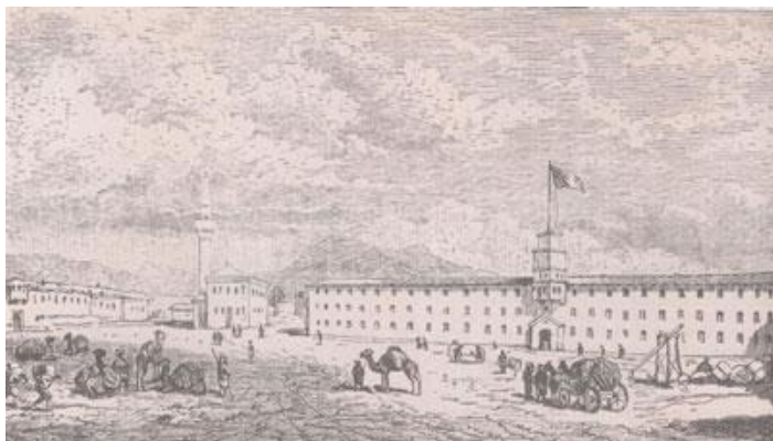
Рисунка на фабрика „Добри Желязков“, Сливен (от 1835)

От 1870 до 1874 г. той е уредник на Кайзерската антропологична природоисторическа колекция, която по-късно става част от Природоисторическия музей на Виена.