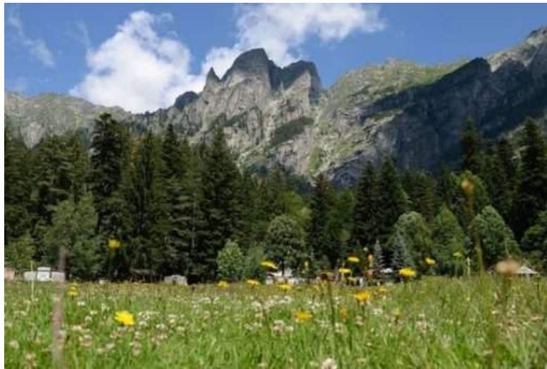
Κίριλoβα πολιάνα (Το ξέφωτο του του πρίγκιπα Κυρίλλου)

Кирилова поляна, https://luckybansko.ru/kirilova-polyana/