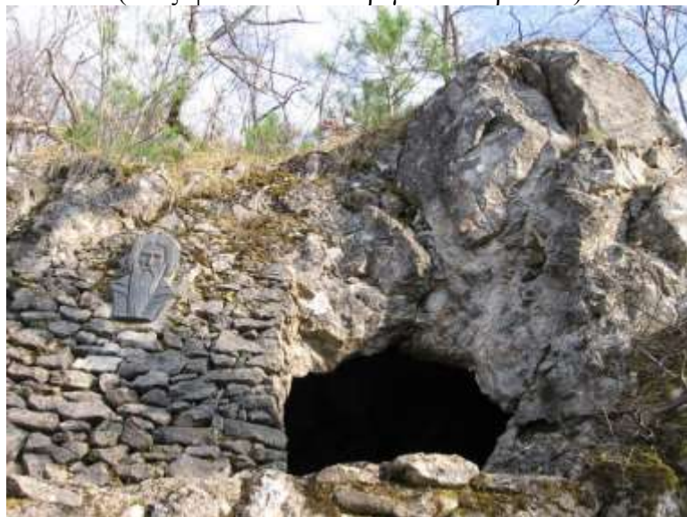
Το σπήλαιο του αγ. Ιωάννη του Ριλιώτη